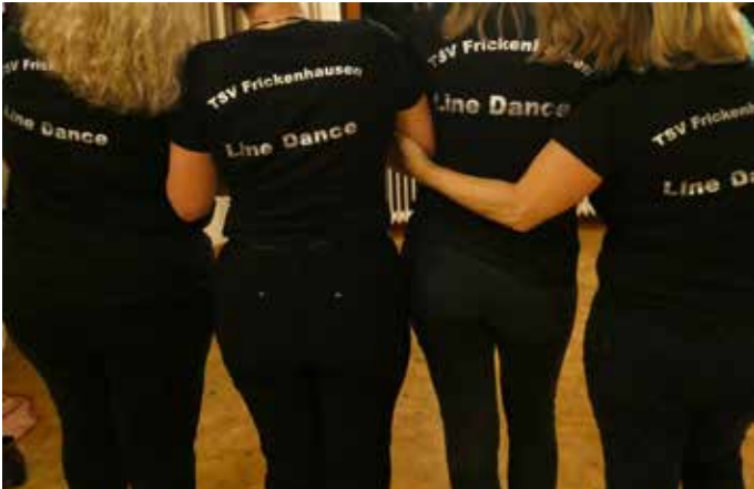
Schlanker mit Modern Line Dance und Zumba!