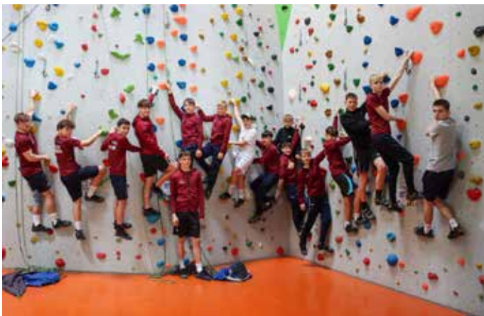
Geschicklichkeit und Mut sind gefragt

Auch am Freitag starteten wir mit einer lockeren Laufeinheit um den See. Danach wurden wir in der Kletterhalle in die Geheimnisse des Kletterns und Sicherns eingewiesen. Neben bis zu 15 m hohen Kletterstrecken in verschiedenen Schwierigkeitsgraden gab es auch viele Möglichkeiten sich im Bouldern zu versuchen. Überhänge bis hin zum Überkopfklettern mussten dabei gemeistert werden.